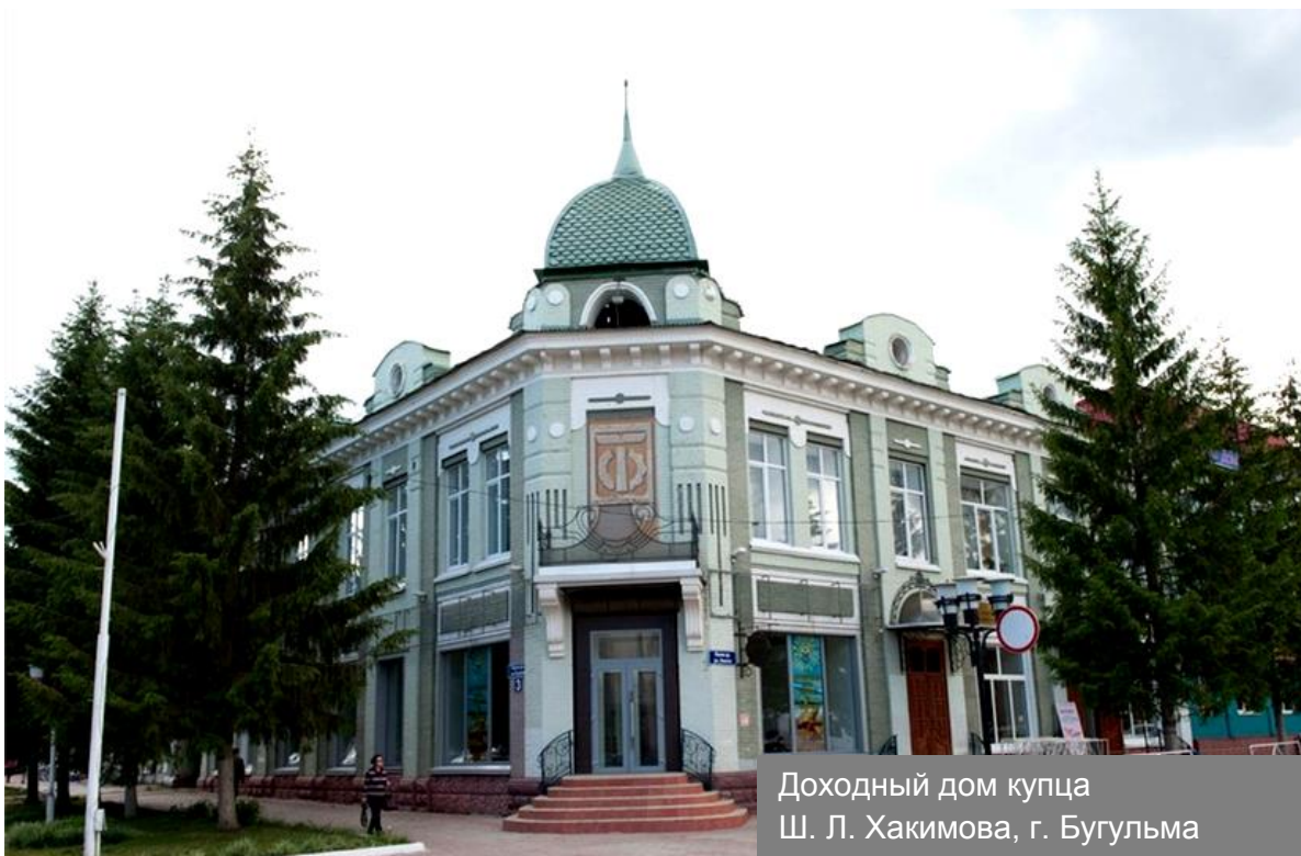
Доходный дом купца Ш. Л. Хакимова, г. Бугульма

Литературно-мемориальный музей Ярослава Гашека в Бугульме является единственным музеем в России, который посвящен автору известного романа «Похождения бравого солдата Швейка». Чешский писатель-сатирик был военным комендантом в доме, в котором в 1966г. был открыт музей в его честь.