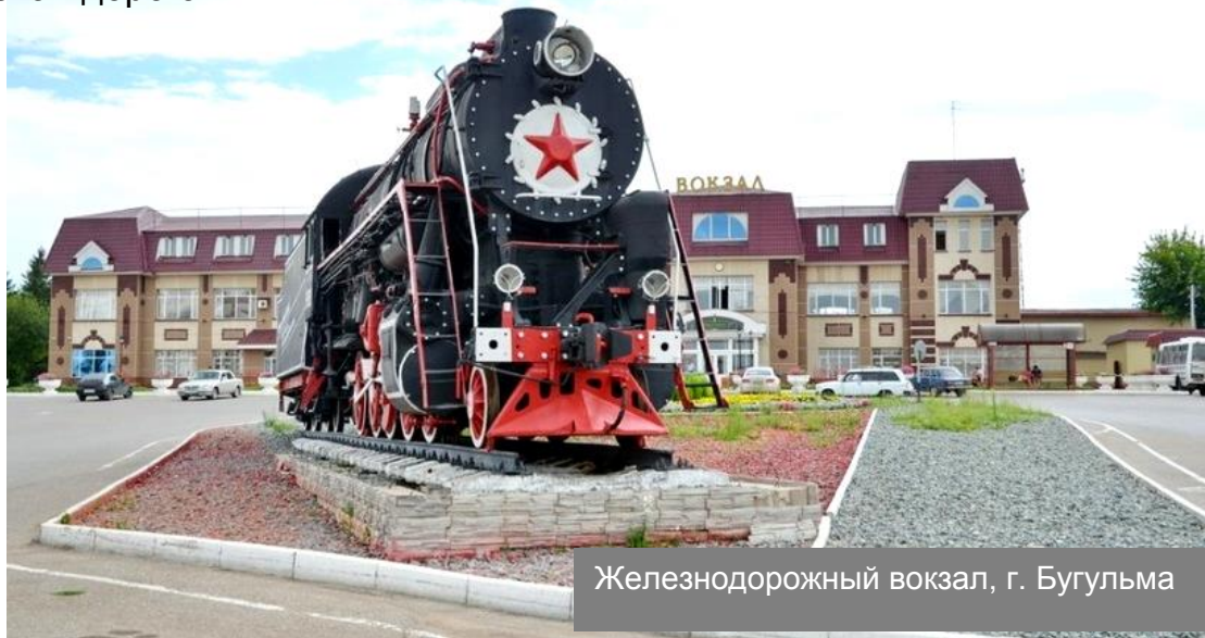
Железнодорожный вокзал, г. Бугульма

В 1911 году через Бугульму была проложена Волго-Бугульминская железная дорога.