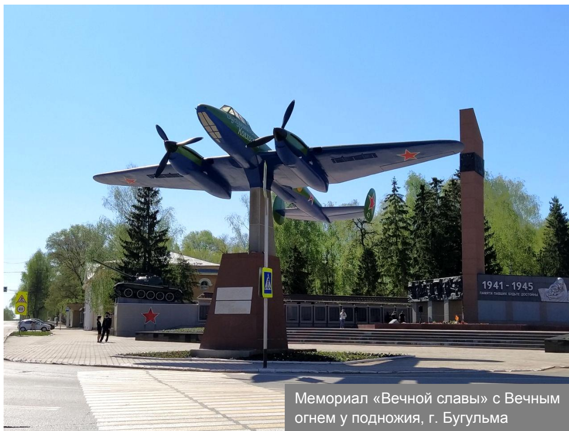
Мемориал «Вечной славы» с Вечным огнем у подножия, г. Бугульма

В начале Великой Отечественной войны, в августе 1941 года в городе была сформирована 352-я Оршанская Краснознамённая ордена Суворова стрелковая дивизия. На добровольные пожертвования бугульминцев была построена танковая колонна «Комсомолец Татарии» и стратегический бомбардировщик Пе-8 «Бугульминский колхозник», который совершал боевые вылеты с мая 1944 года по май 1945 года.